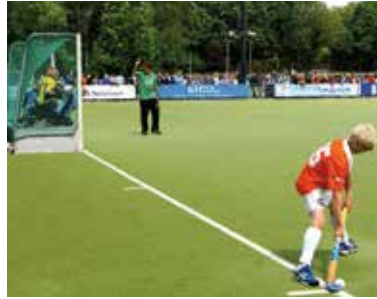
Een stafcorner nemen

De kant van het doel mag je zelf kiezen.