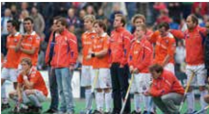
Iedereen staat buiten het 23-metergebied