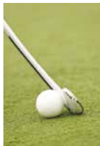
De bolle kant van de stick

Met een scoop mag je de bal wel omhoog spelen als je het niet gevaarlijk doet.