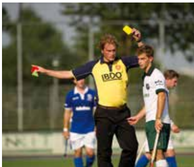
Wisselen bij een persoonlijke straf

Heeft de scheidsrechter je uit het veld gestuurd omdat je een erge overtreding hebt gemaakt? Dan mag je niet worden gewisseld.