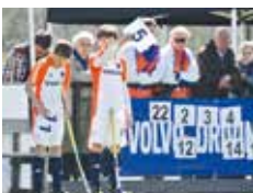
Wisselen van spelers

Je mag spelers die niet in het veld staan altijd wisselen met spelers in het veld. Behalve als er een strafcorner wordt genomen, dan mag je niet wisselen.