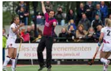
De scheidsrechter geeft een strafbal