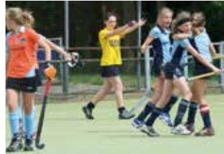
Scheidsrechter die fluit voor een doelpunt