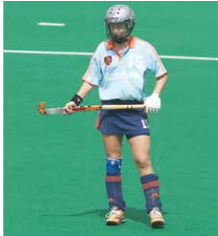
Je moet een helm dragen als je 'vliegende keep' bent bij een strafcorner