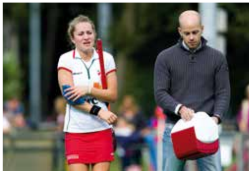
Wisselen bij een blessure