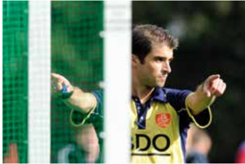
De scheidsrechter geeft een strafcorner aan

Als de scheidsrechter een strafcorner aangeeft, mag je hem altijd nemen. Ook als het het einde is van de speelhelft of wedstrijd.