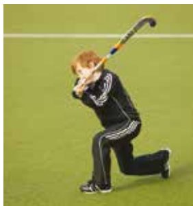
Dit is gevaarlijk stick gebruik