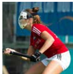
Masker bij strafcorner

moet je schoenbeschermers dragen en mag je een mondbeschermer dragen. Het is wel slim om een mondbeschermer te dragen! Bij een strafcorner mag je als verdediger een masker dragen.