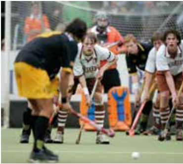
Een vrije slag nemen