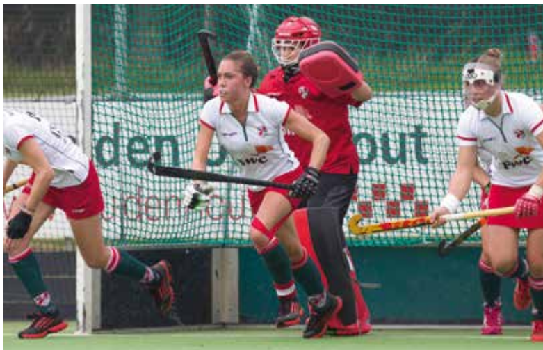
De tegenstanders lopen te vroeg uit

Loopt je tegenstander te vroeg uit, dus voordat jij de bal hebt gespeeld, dan mag je de strafcorner nog een keer nemen. Je tegenstander moet dan aan de andere kant van de middenlijn gaan staan. Dan mogen je tegenstanders dus met één verdediger minder achter hun doellijn staan als je de strafcorner overneemt.